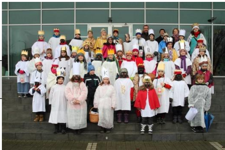
Tříkrálová sbírka v Mokré