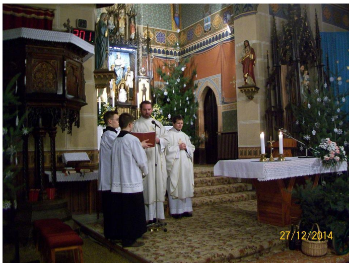
Žehnání vína 27. 12. 2014